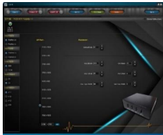
UMCC Resolution Control AP