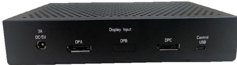
Input Front View