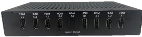
Output Back View